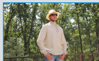
МАСТЕРСКАЯ «РУССКИЙ СТИЛЬ», (Г. НОВОСИБИРСК, РОССИЯ)