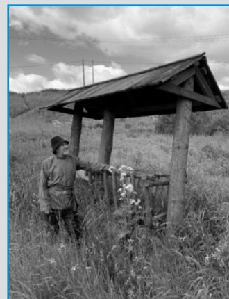
СТУДИЯ НАРОДНОГО КОСТЮМА «ВЕРЕТЁНЦЕ», (Д. КАМЕНКА НА РЕКЕ ЧУСОВОЙ, РОССИЯ)

БУДЬ С НАМИ 12 ИЮЛЯ 2021 ГОДА – НАДЕНЬ КОСОВОРОТКУ – ВСПОМНИ, ЧТО ТЫ – РУССКИЙ!