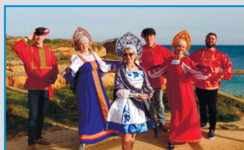
АССОЦИАЦИЯ «ЦПЭ ИЗ ВОСТОЧНОЙ ЕВРОПЫ И ДРУЗЬЯ» (Г. ПОРТИМАВ, ПОРТУГАЛЬСКАЯ РЕСПУБЛИКА)