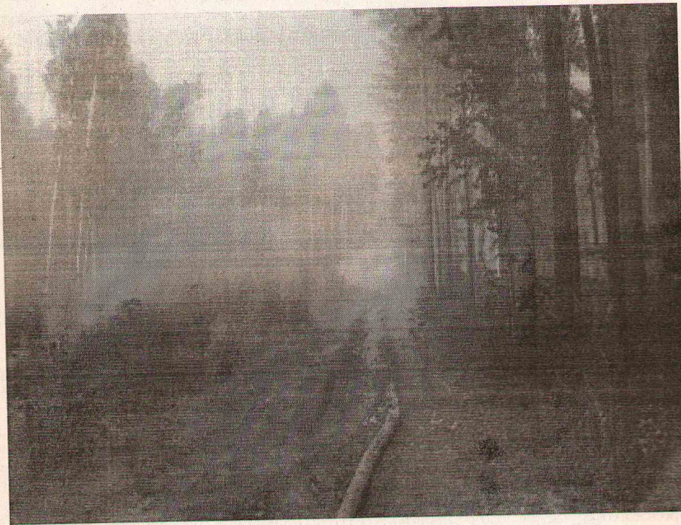
Один из лесных пожаров на территории Сосьвинского округа.

В последние дни ситуация с лесными пожарами в России остается одной из самых актуальных тем. На территории Сосьвинского городского округа на сегодняшний день угрозы населенным пунктам нет, из шести действующих пожаров локализованы пять. Хочется призвать население не впадать в панику.