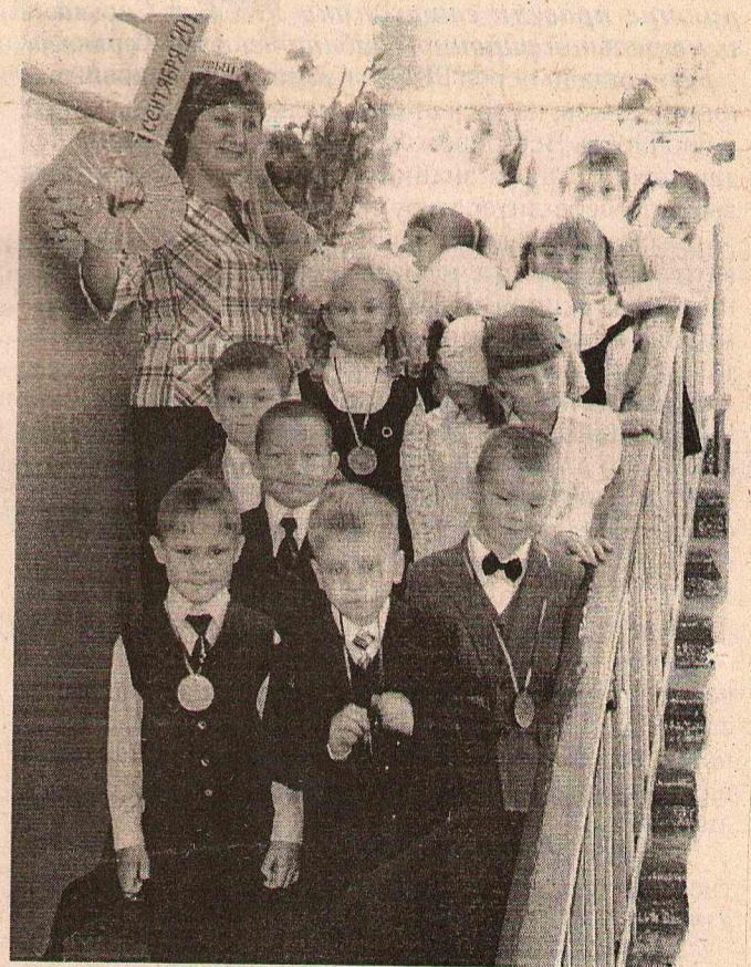
Корону и ключ Знаний - первому учителю, первоклассникам - первые медали. (МОУ СОШ №1 р.п.Сосьва)