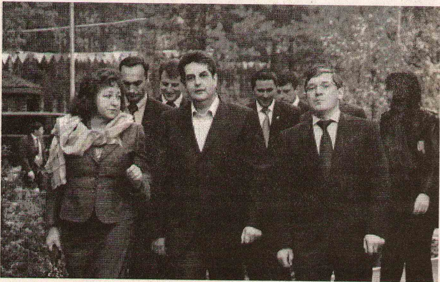
Полномочный представитель президента РФ в УрФО Н. Винниченко (в центре) и губернатор Тюменской области В. Якушев на открытии форума.

На прошедшей неделе в г. Тюмень прошел второй Форум молодежи Уральского федерального округа. В составе делегации Свердловской области мне удалось принять участие в работе форума.