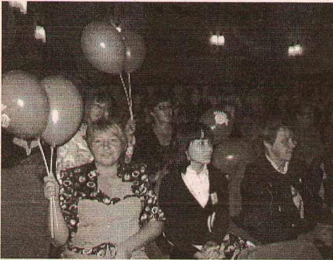
Праздник собрал вместе учителей и воспитателей всего округа.

В минувшую субботу в актовом зале РКСК р.п.Сосьва прошел праздник посвященный Дню учителя. Участие в мероприятии приняли педагоги и воспитатели всех образовательных учреждений Сосьвинского городского округа.