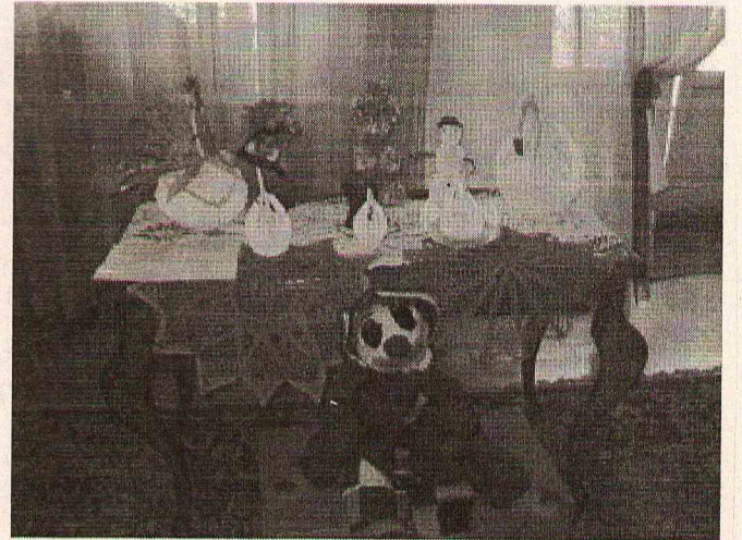
Экспонаты художественной выставки.