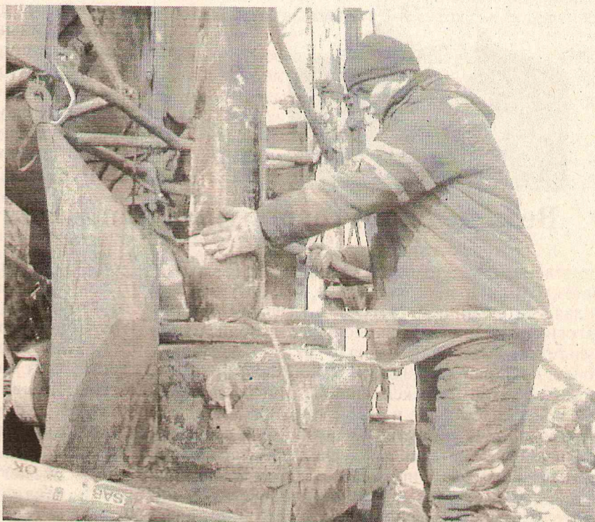
Бурение скважины для электрохимзащиты газовой трубы.

Во-вторых – это активное участие предприятия в общественной и спортивной жизни Сосьвинского городского округа. СМУ-6 неоднократно выступало спонсором многих спортивных мероприятий, выставляя при этом и свои команды. В последнее время предприятие активно поддерживает жен-